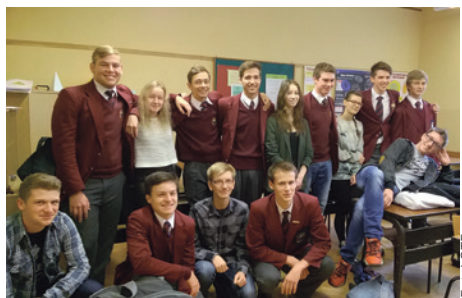
Uczniom z RPA podobało się w Cieszynie.

W czasie 11 dni pobytu w Polsce starali-