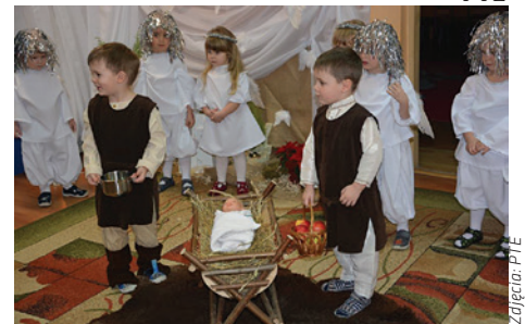
Każde dziecko lubi grudzień.