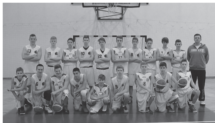
Koszykarskie talenty rosną w Gimnazjum nr 2.

Zawodnicy w większości to wyselekcjonowana grupa uczniów klas 1-3 Gimnazjum nr 2 w Cieszynie. Polski Związek Koszykówki