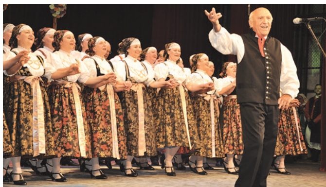
Zespół Pieśni i Tańca Ziemi Cieszyńskiej czekał na siedzibę z prawdziwego zdarzenia wiele lat.