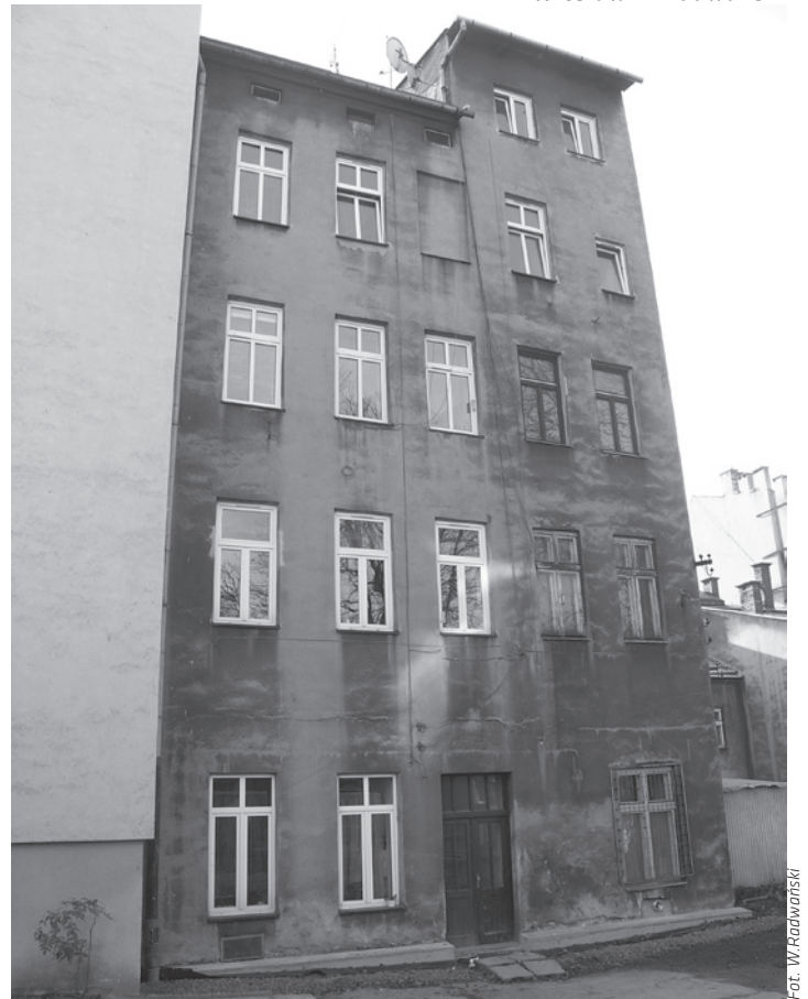
Kamienica przy ul. Głębokiej 54 od strony podwórza.