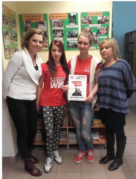
Na młodzież z „Budowlanki” zawsze można liczyć.