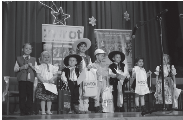
Gwara trzyma się mocno