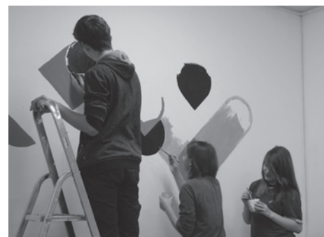
Udział w projekcie stanowił połączenie pracy z zabawą.

Wdrożenie pomysłów w życie stało się prawdziwym wyzwaniem. Niektórzy po raz pierwszy szpachlowali i malowali