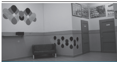
Odnowione wnętrza szkoły.

7 stycznia uczniowie Gimnazjum Towarzystwa Ewangelickiego zakończyli renowacyjną pracę w ramach projektu Design dla szkoły . Ich twórczy wysiłek zaowocował zmianą przestrzeni części korytarza na drugim piętrze budynku. Celem inicjatywy podjętej przez Stowarzyszenie Z Siedzibą w Warszawie w kilku polskich szkołach była diagnoza problemów wynikających z ich topografii czy estetyki oraz „wyleczenie” usterek na drodze współpracy uczniów z projektantem. Działania rozpoczęły się już w październiku ubiegłego roku. W kilka kluczowych etapów zaangażowało się niewielkie, lecz bardzo pracowite i twórcze grono