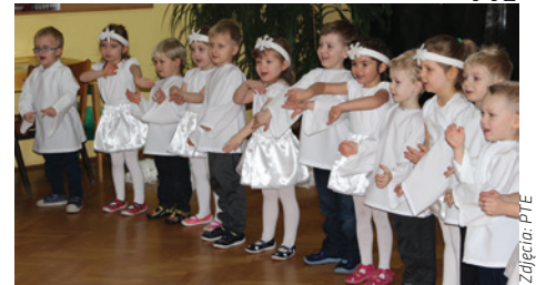
Dzieci skradły serca babciom i dziadkom podczas występu.